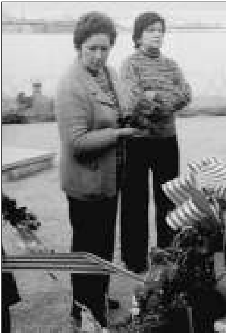
A l'enterrament del seu pare