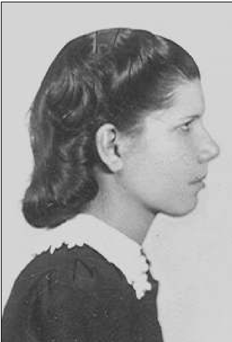
A la seva joventut a Mataró