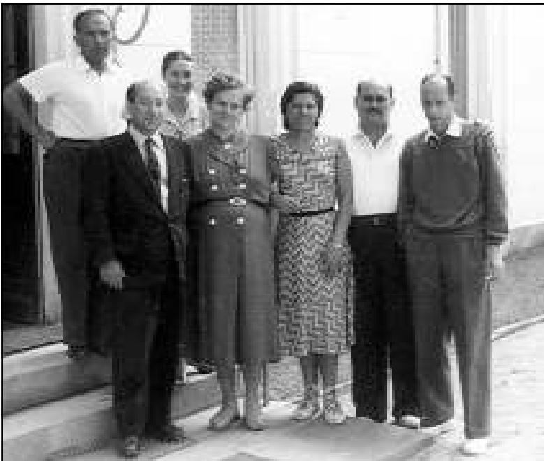
Amb en Julián Grimau i altres membres de la direcció del PCE