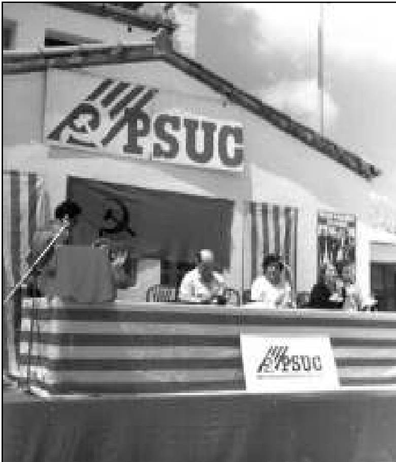
Acte del PSUC amb motiu de les eleccions legislatives del 1977