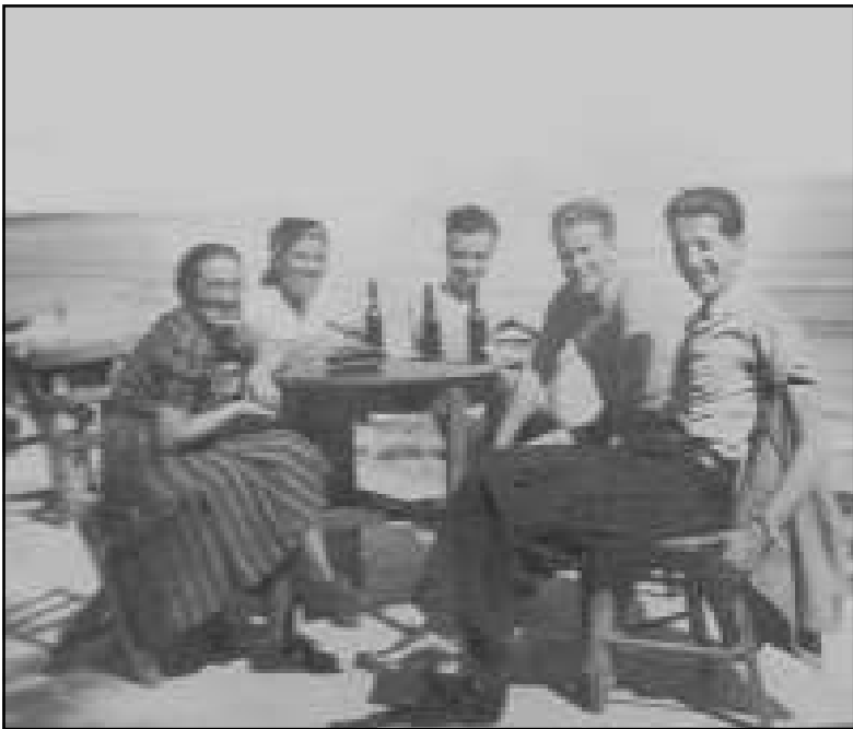
Amb en Gregorio López Raimundo i en Fernando Claudín