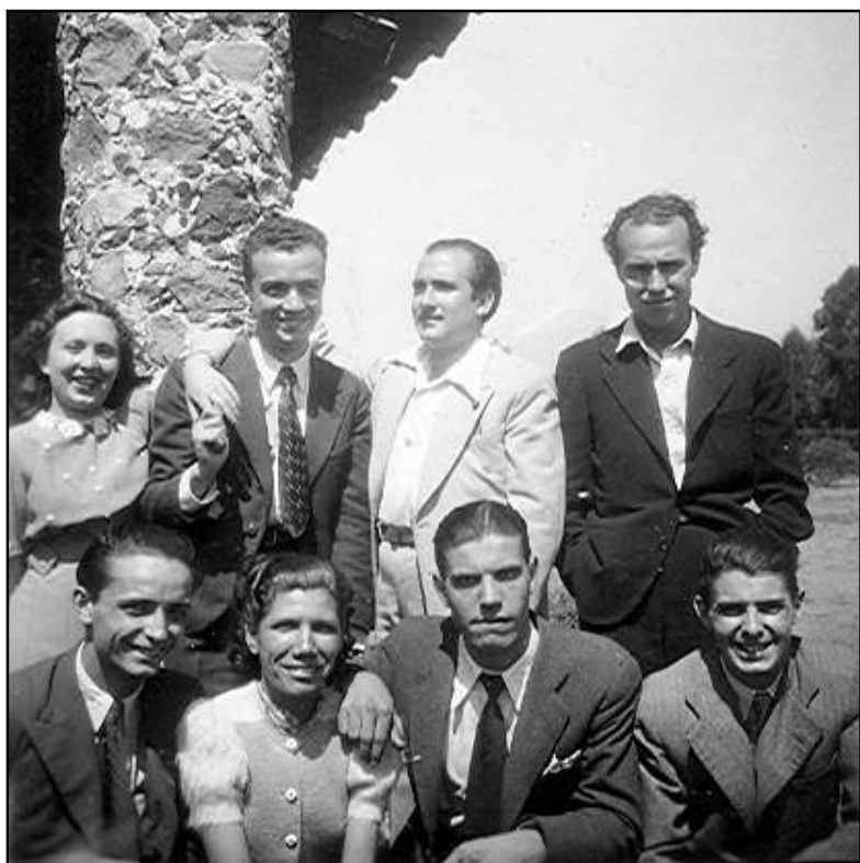
Amb els integrants de La Comuna de Mèxic