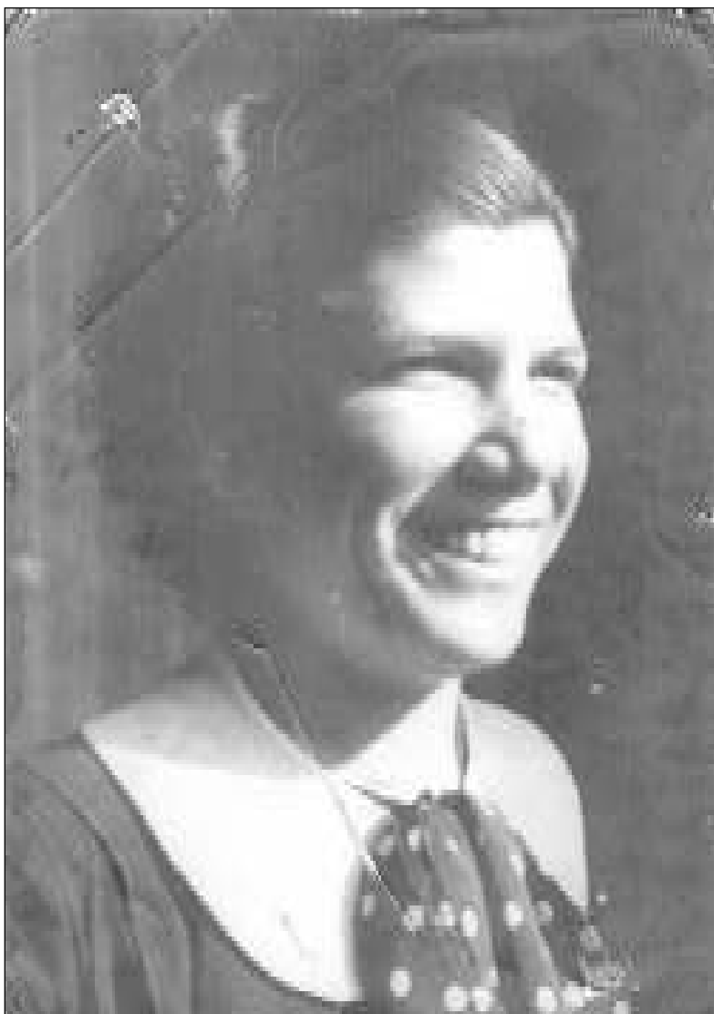
Cap a l'any 1934