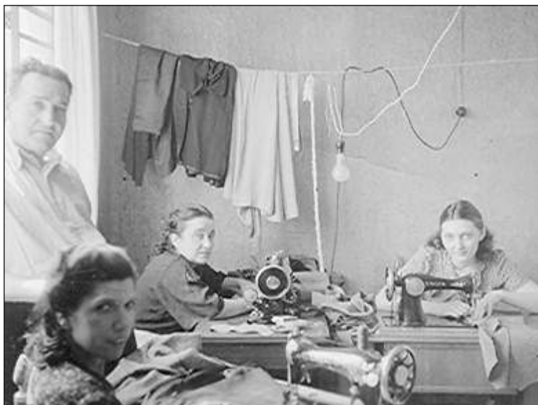
El seu primer treball a l'exili, a Mèxic, en un taller de confecció